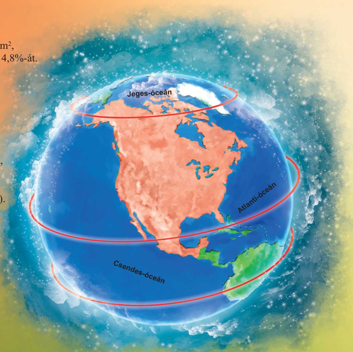
Észak-Amerika elhelyezkedése a Földgömbön

■ Legszélsőbb pontjai: északon a Morris Jessup-fok, nyugaton az Aleut-szigetek, keleten pedig Grönland legkeletibb pontja. Délien a Yucatan-félsziget régiója.